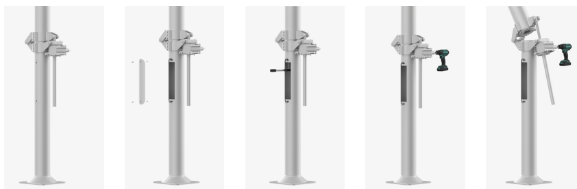
Column diagram of column SAL-85M/P

1. Assembly of (manual or articulated) mechanism on the column